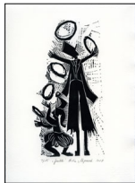
Gaukler | ca. 21,5 x 29,7 cm