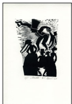
Schausteller | ca. 16,2 x 25 cm